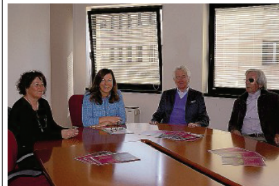
Ascom Parma Un momento della presentazione.