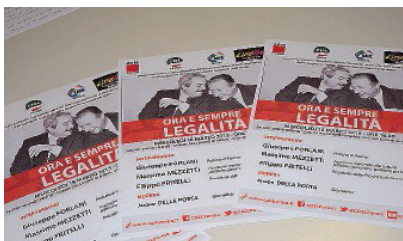
Lotta alla mafia L'incontro di ieri e i volantini sulla legalità.

Forlani - ha aggiunto - si è impegnato a convocare la conferenza delle amministrazioni locali per sensibilizzare i comuni sul tema della legalità».