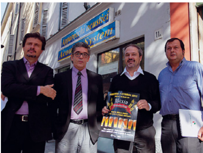
Brindisi in via Bixio Domenica stand e tante golosità in Oltretorrente.