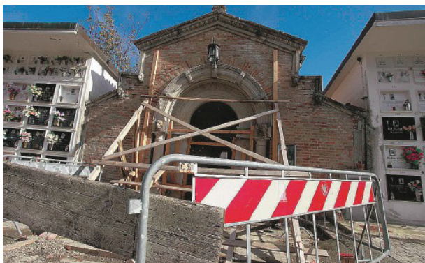
Contignaco La cappella del cimitero non è agibile ormai da vari anni.