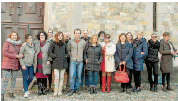
Fornovo Alcuni dei partecipanti al progetto.

Primo passo per questo percorso, l'incontro tra l'esperta ed i singoli commercianti. «Bisogna