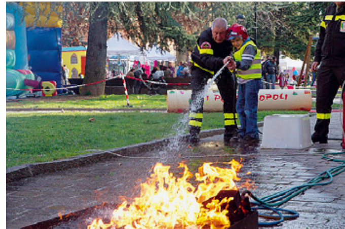
Folla al Pablo Bancarelle, giochi per i bimbi e anche «Pompieropoli» ieri alla festa del quartiere.