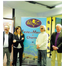
Ascom Focus su Parma Viva.

«Festa di San Giuseppe» (16 marzo) con l'85% degli operatori di strada D'Azeglio, favorevoli all'evento; «Primavera in quartiere Pablo» (13 aprile) 88% del totale operatori del comparto Pablo, favorevoli; «Primavera in San Leonardo» (27 aprile), 91% del totale operatori via Trento/S Leonardo, favorevoli; «Festa dei Fiori» in strada Farini (4 maggio) con l'88% del totale operatori via Farini, favorevoli. Infine, per la «Festa di strada Garibaldi», si è espresso a favore l'87% degli operatori della zona. «Vorrei ricordare - aggiunge