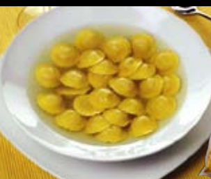
Cappelletti speciali con carne