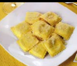
Tortelli alla Parmigiana

Tutto il gusto della pasta fresca sulla tua tavola