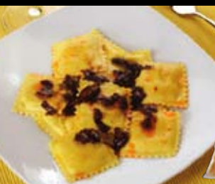
Tortelli di patate