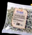
Chicche della Nonna