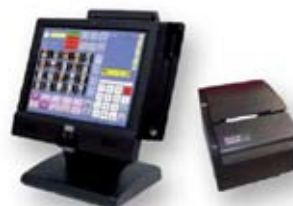
sistema computerizzato di cassa

CENTRO ACCREDITATO DALLA CCIAA DI PARMA PER LA VERIFICA METRICA PERIODICA SU TUTTO IL TERRITORIO NAZIONALE