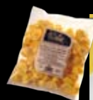
Cappelletti speciali senza carne