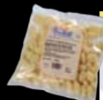
Gnocchi di patate