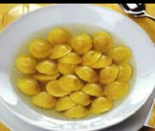
Cappelletti alla Parmigiana