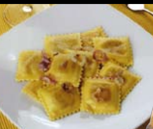
Tortelli di zucca