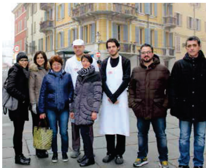
Alcuni commercianti di via D'Azeglio

i "regali" sono stati messi a disposizione dai commercianti della via, mentre il ricavato è stato devoluto al reparto di Ematologia dell'Ospedale per finanziare borse di studio per la ricerca. Via D'Azeglio invece, ha ospitato la decima edizione di "Natale Sotto l'Albero". Bancarelle di abbigliamento, artigianato, hobbistica, alimentari e tanto altro hanno colorato la via dell'Oltretorrente parmigiano. Presenti anche giochi e attrazioni per i più piccoli in Piazzale dell'Annunziata. La manifestazione ha visto il coinvolgimento di differenti associazioni di volontariato.