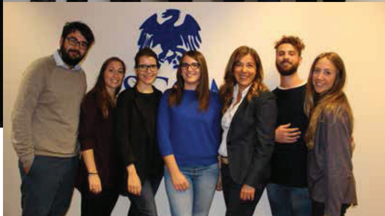
Dall'alto i gruppi: Ascom@Uniwork area Marketing; Ascom@Uniwork area Comunicazione