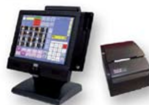
sistema computerizzato di cassa

CENTRO ACCREDITATO DALLA CCIAA DI PARMA PER LA VERIFICA METRICA PERIODICA SU TUTTO IL TERRITORIO NAZIONALE