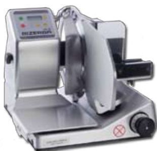
attrezzature per la lavorazione dei degli alimenti

SOLUZIONI HARDWARE E SOFTWARE PER OGNI TIPO DI ATTIVITÀ, BILANCE, ATTREZZATURE PER LA LAVORAZIONE DEGLI ALIMENTI E SISTEMI ANTITACCHEGGIO