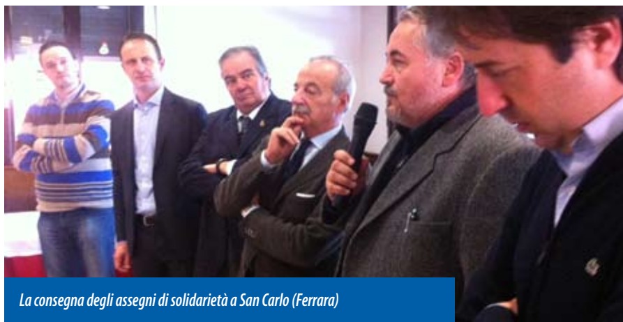
La consegna degli assegni di solidarietà a San Carlo (Ferrara)

Si intitola "Marzo con Verdi" la nuova iniziativa di Parma Incoming che, in collaborazione con Fucina Italia, vede protagonisti Il Teatro Verdi di Busseto e il Teatro Comunale Pavarotti di Modena, e che porterà appassionati di lirica a scoprire Verdi e il suo territorio. In occasione della recita dell'Otello, in programma a Modena il prossimo 15 marzo, e del concerto privato "Un giorno di Regno" dall'Accademia della Scala il 17 marzo, Parma Incoming ha studiato un pacchetto turistico di due/tre giorni comprendente l'opera e il raffinato concerto, quindi visite culturali e enogastronomiche in tutta la provincia di Parma. L'iniziativa, sfruttando anche l'eco del Bicentenario Verdiano, ha l'obiettivo di stimolare ulteriormente la presenza di turisti sul territorio, invitati a scoprire le eccellenze culturali e non, perché "sono molte le cose che rendono inconfondibile questo spicchio di Italia chiamato "Terre Verdiane".