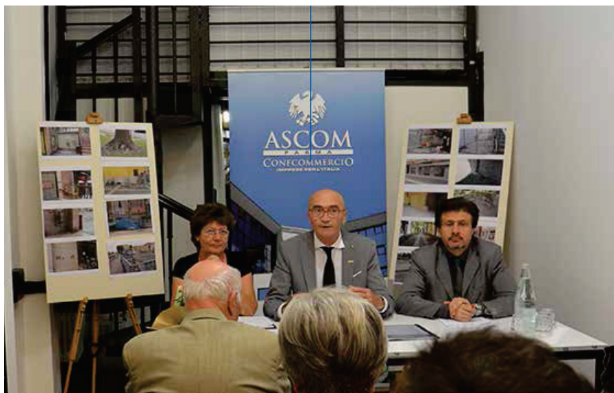
Nelle immagini, in alto un momento della conferenza stampa organizzata da Ascom Parma; sotto un angolo di Piazza Ghiaia pieno di rifiuti e cartoni; in basso un'immagine dell'Oltretorrente. Nell'altra pagina, in alto ancora Oltretorrente, al centro rifiuti nei pressi della stazione, in basso Galleria Bassa dei Magnani.

RACCOLTE CIRCA 400 FIRME DI OPERATORI DEL CENTRO PER LIMITARE IL DISORDINE URBANO E TORNARE AD AMARE PARMA, DONANDOLE LA SUA ORIGINARIA PULIZIA