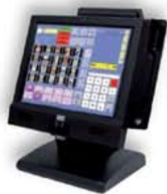
sistema computerizzato di cassa

Soluzioni hardware e software per ogni tipo di attività, bilance, attrezzature per la lavorazione degli alimenti e sistemi antitaccheggio