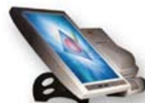
sistemi computerizzati di cassa per negozi e ristoranti