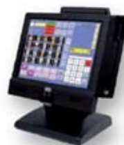
sistema computerizzato di cassa

CENTRO ACCREDITATO DALLA CCIAA DI PARMA PER LA VERIFICA METRICA PERIODICA SU TUTTO IL TERRITORIO NAZIONALE