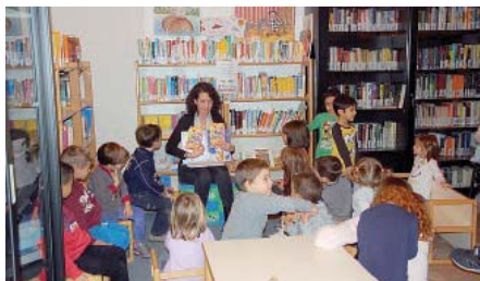
INIZIATIVA Letture in biblioteca.

■ Fontevivo Prenderanno il via dopo Pasqua gli ultimi lavori in programma nella biblioteca «Vanda Negri», finalizzati a creare un ambiente più accogliente per i tanti utenti, che ogni settimana ne utilizzano gli spazi. Dopo l'acquisto di tablet e pc, fra qual-