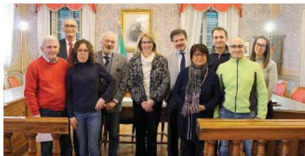
RIQUALIFICARE IL CENTRO Un progetto per Busseto.

■ BUSSETO Dal miglioramento dell'accessibilità alla sicurezza, dallo sviluppo della rete commerciale agli interventi di animazione del paese: questi in sintesi i contenuti del «Progetto per la valorizzazione e riqualificazione del centro storico» presentato dal Comune di Busseto e finanziato dalla Regione. Oltre 350mila euro verranno investiti (di cui 134mila da contributo regionale) per la riqualificazione urbana di