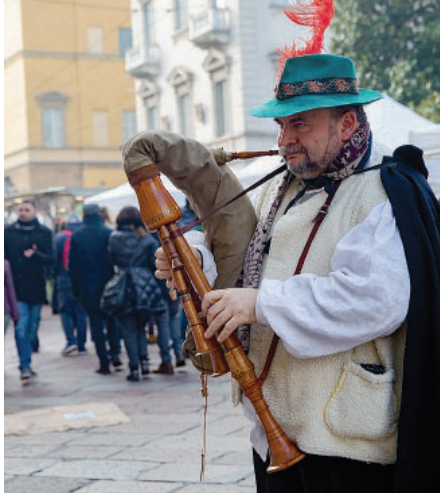
NON SOLO BANCARELLE Uno zampognaro in via Garibaldi.

■ Il freddo era pungente, ma in qualche modo mitigato dalla splendida giornata di sole che ha reso così ancora più partecipato il tradizionale appuntamento con la festa di Santa Lucia, andato in scena per tutta la giornata di ieri lungo via Garibaldi. Una manifestazione promossa da Ascom attraverso il marchio Parma Viva, con l'organizzazione affidata a Edicta Eventi ed il patrocinio del Comune di Parma, che ha richiamato davvero un gran numero di visitatori: anziani, giovani coppie, famiglie con bambini, che hanno deciso di immergersi nell'atmosfera gioiosa di un centro storico che si prepara ad accogliere le festività natalizie, ormai imminenti. E a colorare di allegria e dolcezza la giornata dei parmigiani, lungo via Garibaldi, è stato un mercatino di qualità, con una serie di stand sele-