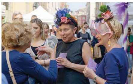
FESTA DEI FIORI In via Farini un trionfo di colori e profumi per tutto il giorno.

supporto di docenti, ricercatori, studenti e volontari dell'Università di Parma. L'ingresso era gratuito e consentiva ai curiosi di accedere anche al Museo di Storia Naturale: poco prima di pranzo, erano già quasi 300 i tagliandi staccati.