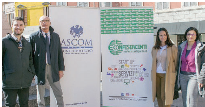
SAN GIUSEPPE La presentazione della sagra.

Tante le iniziative che animeranno l'intera giornata. via D'Azeglio sarà il cuore pulsante degli eventi targati Ascom che propone un mercato di qualità, con artigianato artistico e specialità enogastronomiche. Due le mostre fotografiche, a cura rispettivamente dell'Associazione Parma Fotografica, sotto i portici dell'ospedale Vecchio, e del Csi-Centro sportivo italiano, all'Oratorio di S. Ilario. In piazzale dell'Annunziata, spazio al «tunnel di battuta» dell'Oltretorrente Baseball. Altri stand saranno presenti in via Imbriani ed in via Bixio, su iniziativa di Confesercenti. Che, grazie alla partnership con Bi&Bi Eventi,