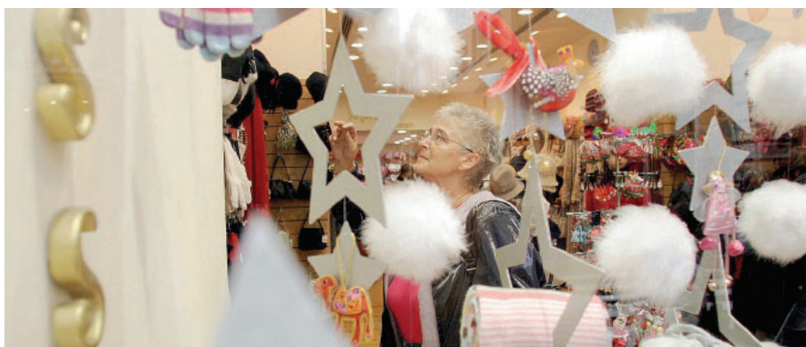
ANDAMENTO VENDITE NATALIZIE 2018

circa 175 euro a persona, più o meno stabile rispetto a quella dell'anno scorso. L'ammontare complessivo delle vendite, sempre secondo Confesercenti, in Emilia-Romagna dovrebbe aggirarsi intorno ai 595 milioni di euro.